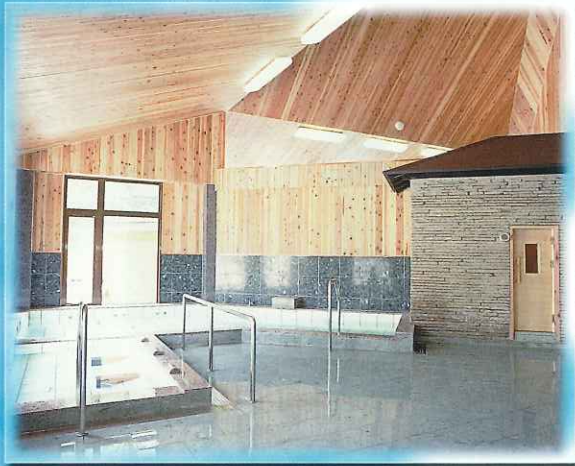
●サウナや寝湯などのある内湯