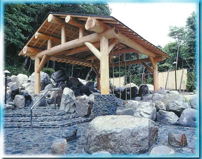
●板室深谷の四季を満喫できる露天風呂