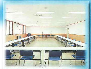
●会議や研修などに利用できる会議室