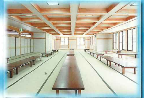
●100畳数の広い談話室