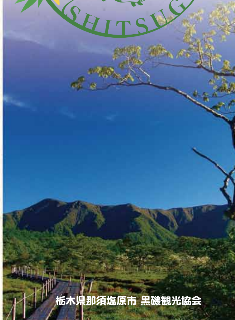
栃木県那須塩原市 黒磯観光協会